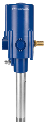
18516 051 Pneumatikk-Fett- + Silikonpumpe 10:1-SRL 1000-200 kg-Behälter